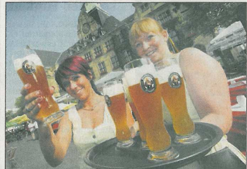
Die gute Laune und der Getränkekonsum hängen auch bei „Zu Gast“ vom Wetter ab.